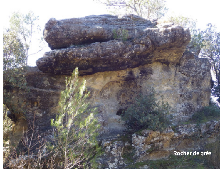
Rocher de grès

Pupitre d'interprétation / interpretation panel