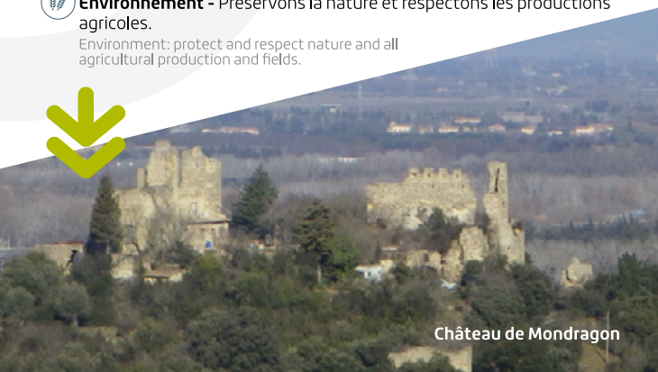
Château de Mondragon