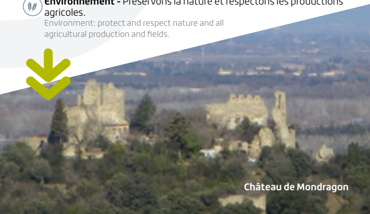
Château de Mondragon