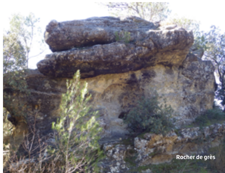
Rocher de grès

Pupitre d'interprétation / interpretation panel