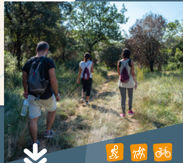
Petitimbet - GRUP

Circuit de BOISSOUTEYRAND De collines en vallons