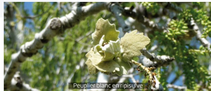
Peuplier blanc en ripisylve

5 LES PÂTURAGES , vous allez traverser des zones pâturées, pensez à bien refermer les barrières après votre passage.