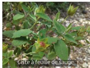
Ciste à feuille de sauge

2 AT THE FIRST CROSSING WITH THE OTHER PATHS , turn left and go up sandy ravines. This open and hot woody area is made up mostly of maritime pine trees and sageleaf rockrose.